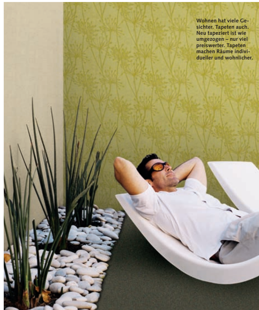
Wohnen hat viele Gesichter. Tapeten auch. Neu tapeziert ist wie umgezogen – nur viel preiswerter. Tapeten machen Räume individueller und wohnlicher.

Die ersten bedruckten Wandpapiere für bürgerliche Haushalte stammen aus dem 14. Jahrhundert; einer Zeit, in der die Papierherstellung noch als handwerkliche Kunst galt. Erst die Kombination von Papierherstellung und Druck ermöglichte eine Art Serienfertigung. In französischen und englischen Papiermanufakturen entstanden als Vorläufer der Tapete die so genannten Dominotiers. Sie wurden bereits im 17. Jahrhundert mit Modellen aus Holz gedruckt und hatten Rapportmuster, die eine fortlaufende